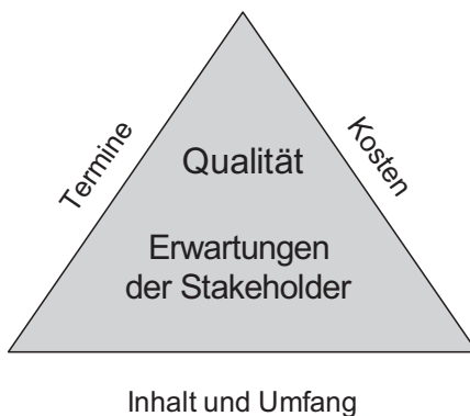
Abb. 2-1 Das magische Dreieck (»Das PMP-Examen« 2 , Abb. 3.1, S. 47)

Dabei hängt die Art der zentralisierten Aufgaben und Tätigkeiten u.a. sehr stark vom Reifegrad des Unternehmens hinsichtlich des Projektmanagements ab. Je reifer ein Unternehmen das Projektmanagement implementiert hat, desto mehr Aufgaben werden in einem PMO angesiedelt sein. Es kann Verwaltungs- und Sekretariatsarbeiten übernehmen, aber auch unternehmensweite Standards für das Projektmanagement setzen oder die Projektleiter zentral schulen.