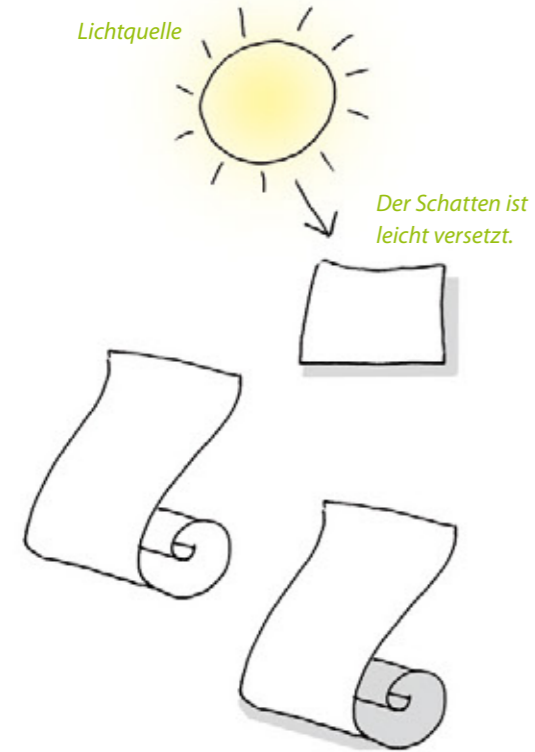
Der Schatten ist leicht versetzt.