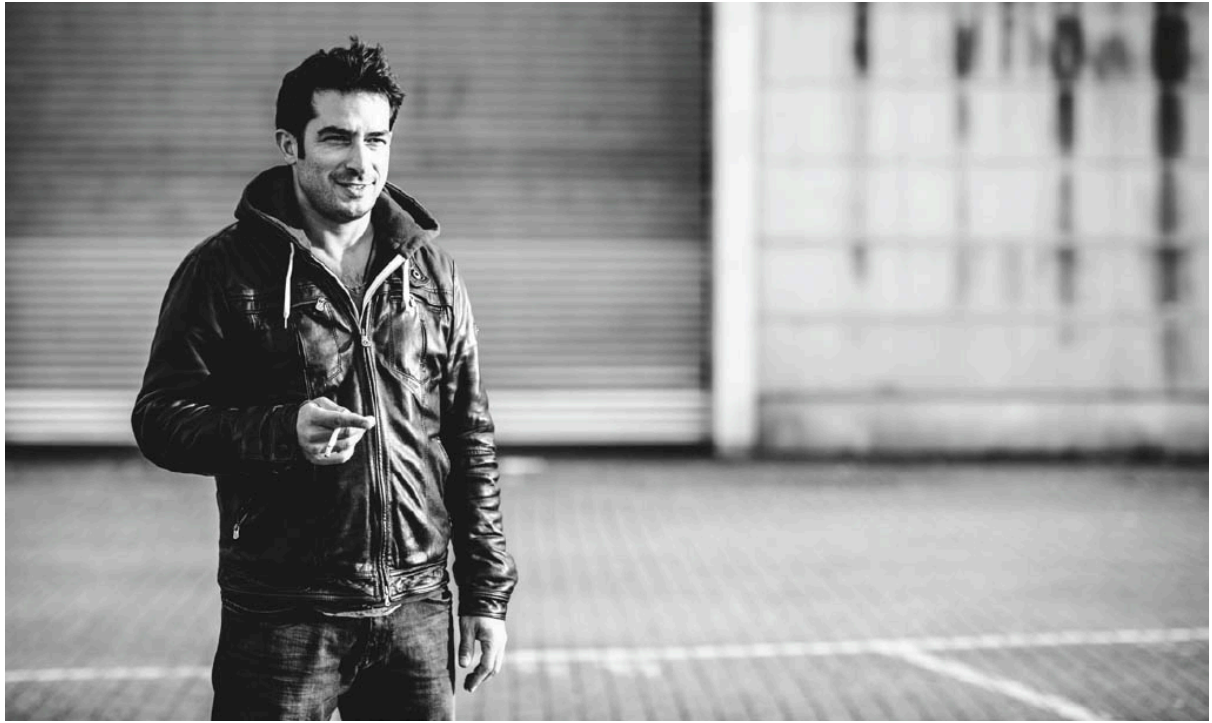
85 mm, ISO 100, f/1.4, 1/800 Sek.