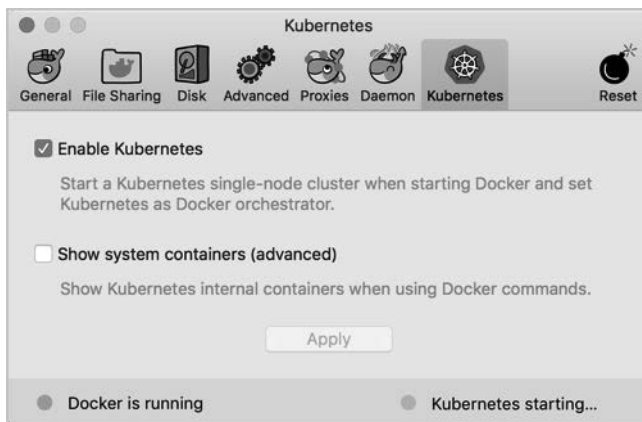
Abb. 2–1 Kubernetes-Support in Docker Desktop aktivieren

Wenn nicht, ist das kein Problem. Docker Desktop besitzt auch Kubernetes-Support. (Linux-Anwender schauen sich bitte Abschnitt 2.6 an.) Um ihn zu aktivieren, öffnen Sie die Docker Desktop Preferences, wählen den Kubernetes-Tab aus und markieren Enable Kubernetes (siehe Abbildung 2–1).