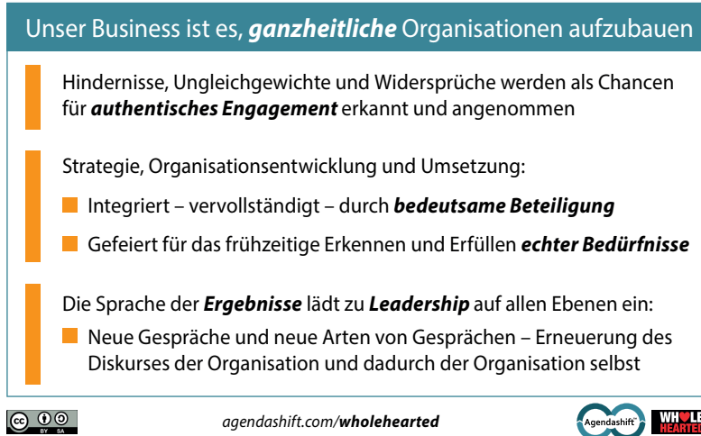
Abb. 1 Unser ganzheitliches Mission Statement

Die fettgedruckten Wörter stehen für einige Werte: