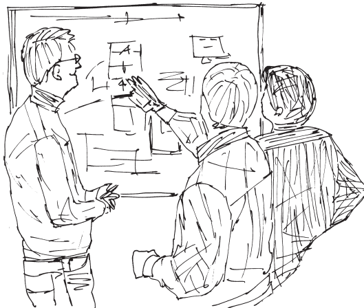
Abbildung 1: In einer idealen Welt kommunizieren Entwickler und Mitarbeiter aus den Fachbereichen direkt und konfliktfrei.

Warum nur machen uns die anderen immer das Leben so schwer? Dabei könnte es doch so einfach sein. Bereits seit längerer Zeit arbeiten wir ganz agil direkt mit den Fachbereichen am Whiteboard zusammen. So entstehen Konzepte, deren Umsetzung bei den Anwendern eine hohe Akzeptanz haben wird. Es werden nur jene Aufgaben betrachtet, die wirklich realisiert werden sollen und zu gut wartbarem Code führen (Abb. 1).