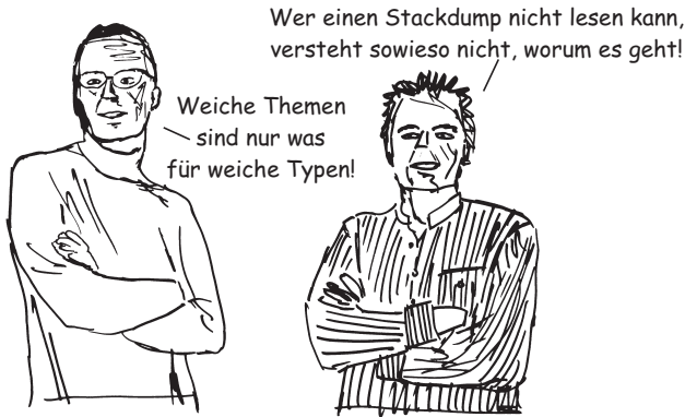
Abbildung 4: Wie wirken die beiden echten Programmierer auf Sie?

ne die parallele Entwicklung des Straßennetzes kaum vorstellbar. Ebenso sind Projekte und ihre Infrastruktur eng miteinander verwoben. Dabei sind die Soft Skills wie die Reifen eines Autos. Sie sind die Überträger unserer Leistungsfähigkeit auf die Straße (Abb. 5).