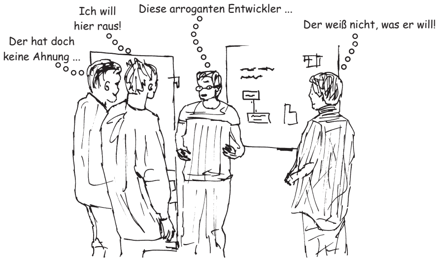
Abbildung 2: Häufig erleben wir in unserer realen Welt eine alles andere als konstruktive Kommunikation. Die gegenseitige, abwertende Meinung legt den Grundstein für aufkommende Konflikte.