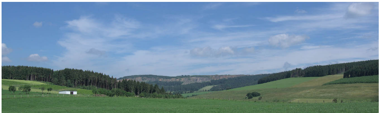
Die Aussicht geht bis zum Clemensberg

Olympus OMD E-M1 MIII · 12–40 mm · f/2.8 · 40 mm · 1/125 s · ISO 200