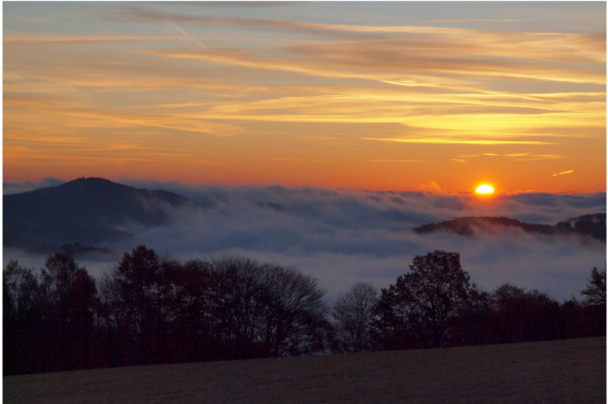
Obheiter am Schmantelrundweg

Olympus E30 · 12–60 mm · f/18 · 52 mm · 1/60 s · ISO 200