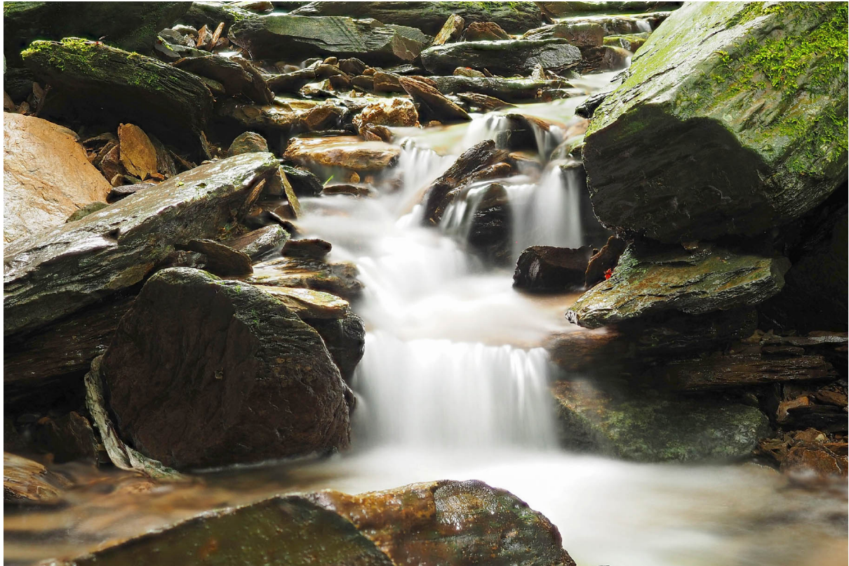
Bachlauf im Schluchtenpfad

Olympus OMD E-M1 MIII · 12–40 mm · f/2.8 · 32 mm · 10 s · ISO 200 · ND64-Graufilter