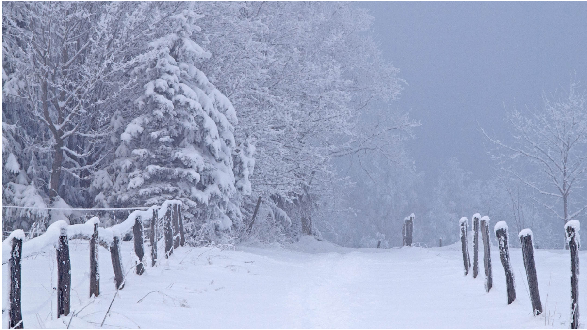
Ein grauer Wintertag am Schmantelrundweg

Olympus E30 · 12–60 mm · f/5.6 · 60 mm · 1/250 s · ISO 200