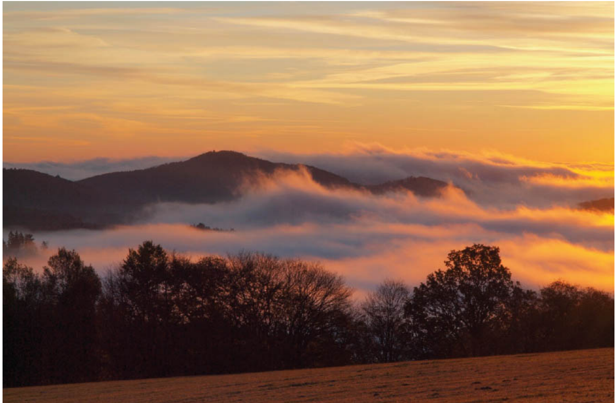
Inversionswetterlage am Schmantelrundweg

Olympus E30 · 12–60 mm · f/18 · 60 mm · 1/50 s · ISO 200