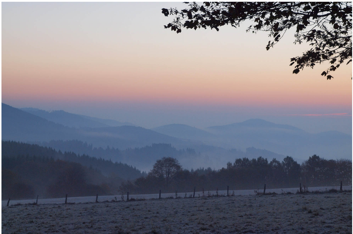
Kühler Oktobermorgen am Schmantelrundweg

Olympus E M1 MIII · 60 mm · f/5.6 · 60 mm · 1/8 s · ISO 200