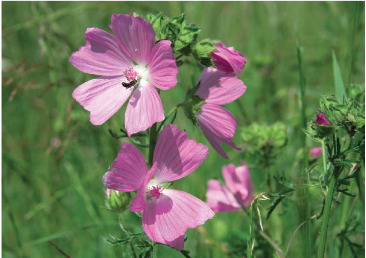
Vergessen Sie die Pflanzen am Wegesrand nicht, wie z. B. diese Malven Olympus OMD E-M1 MIII · 12–40 mm · f/5.6 · 35 mm · 1/1000 s · ISO 200