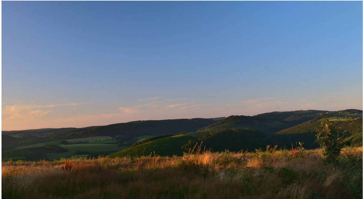
Abendliches Panorama in Hoheleye

Panasonic DC-S5 · 24–70 mm · f/18 · 1/4 s · 24 mm · ISO 100