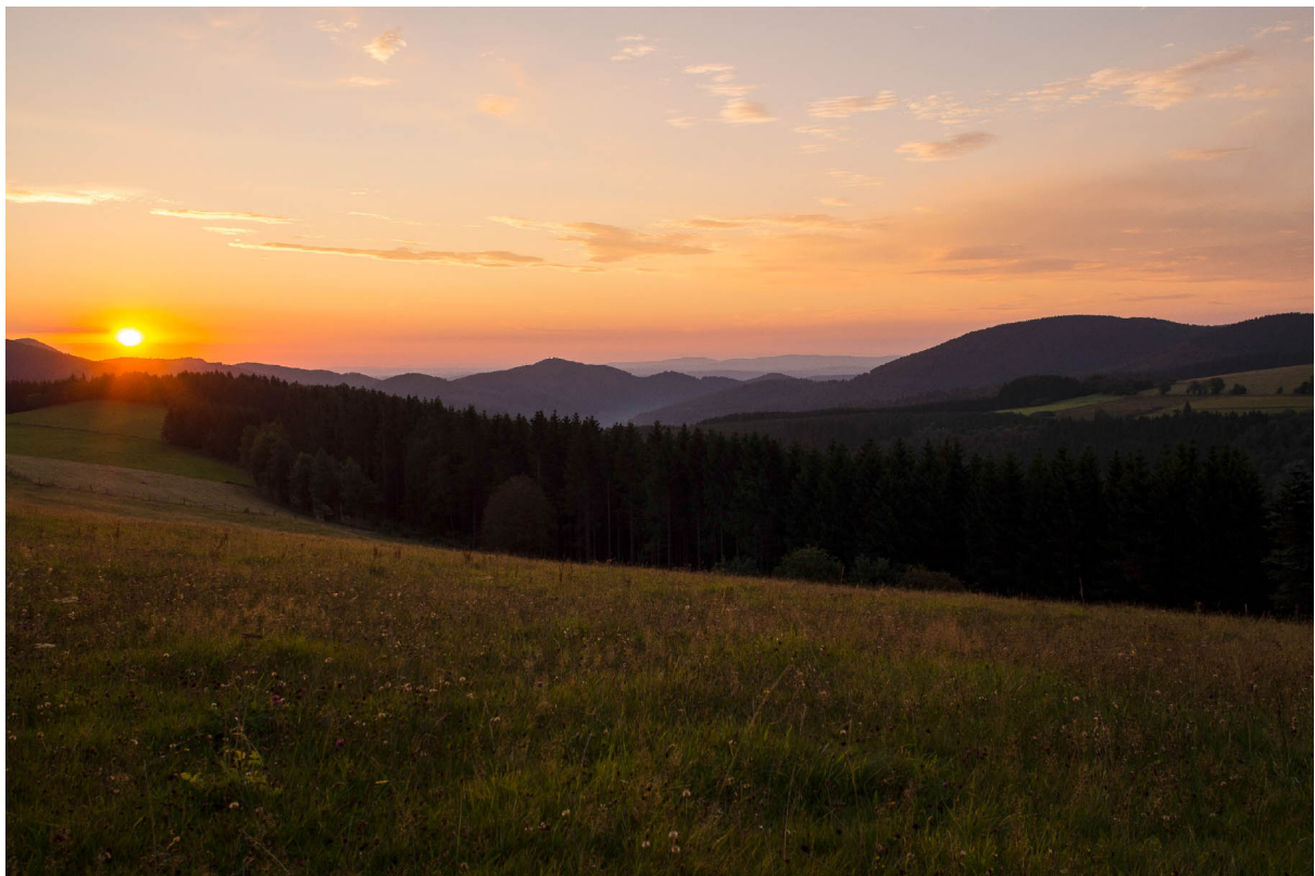
Sonnenaufgang am Kreuzbergweg

Olympus E30 · 12–60 mm · f/5.6 · 60 mm · 1/250 s · ISO 200