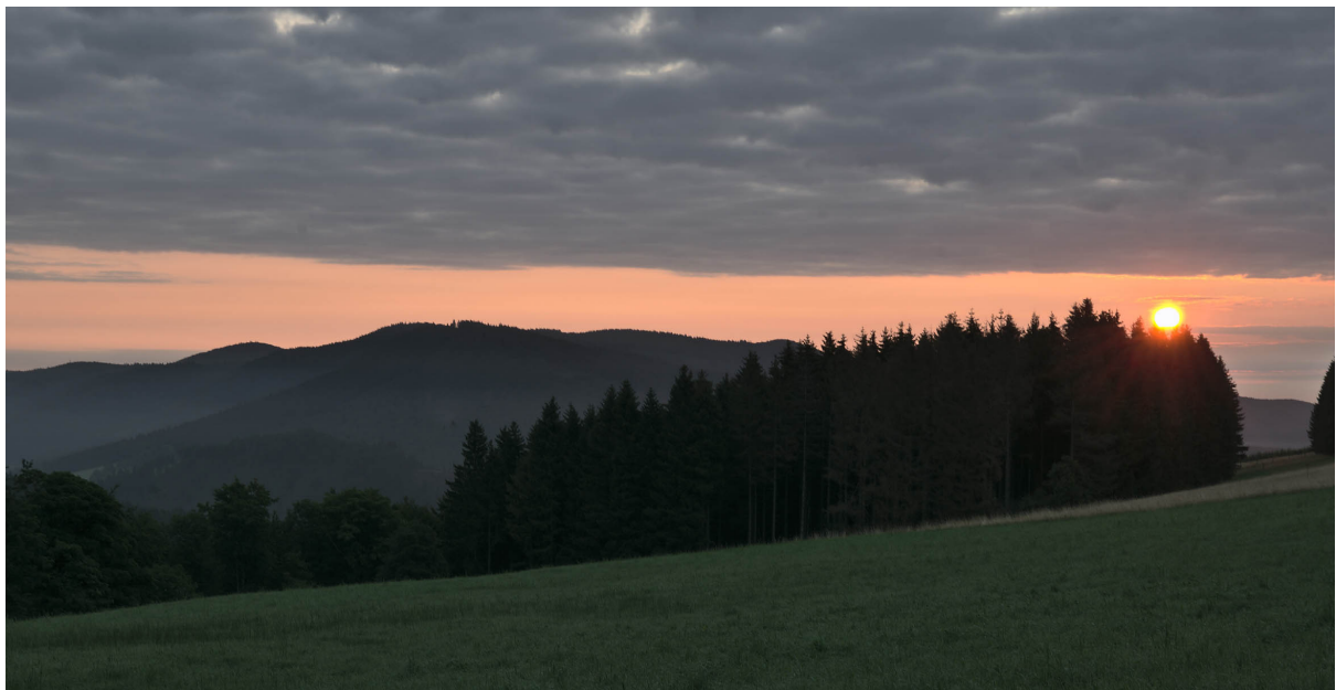
Morgens am Hesborner Weg

Olympus OMD E-M1 MIII · 12–40 mm · f/2.8 · 32 mm · 10 s · ISO 200 · ND64-Graufilter