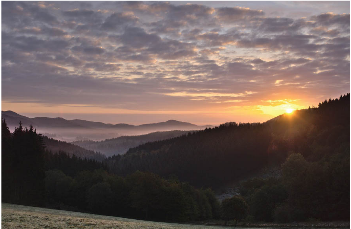
Sonnenaufgang am Schmantelrundweg

Olympus OMD E-M1 MIII · 12–40 mm · f/5.6 · 21 mm · 1/60 s · ISO 200