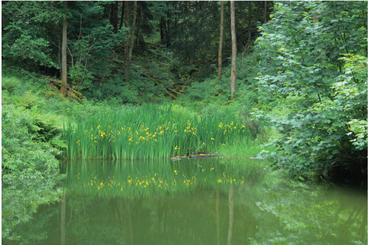
Teich an der Ruipes-Ropes-Hütte

Olympus OMD E-M1 MIII · 12–40 mm · f/2.8 · 40 mm · 1/125 s · ISO 200