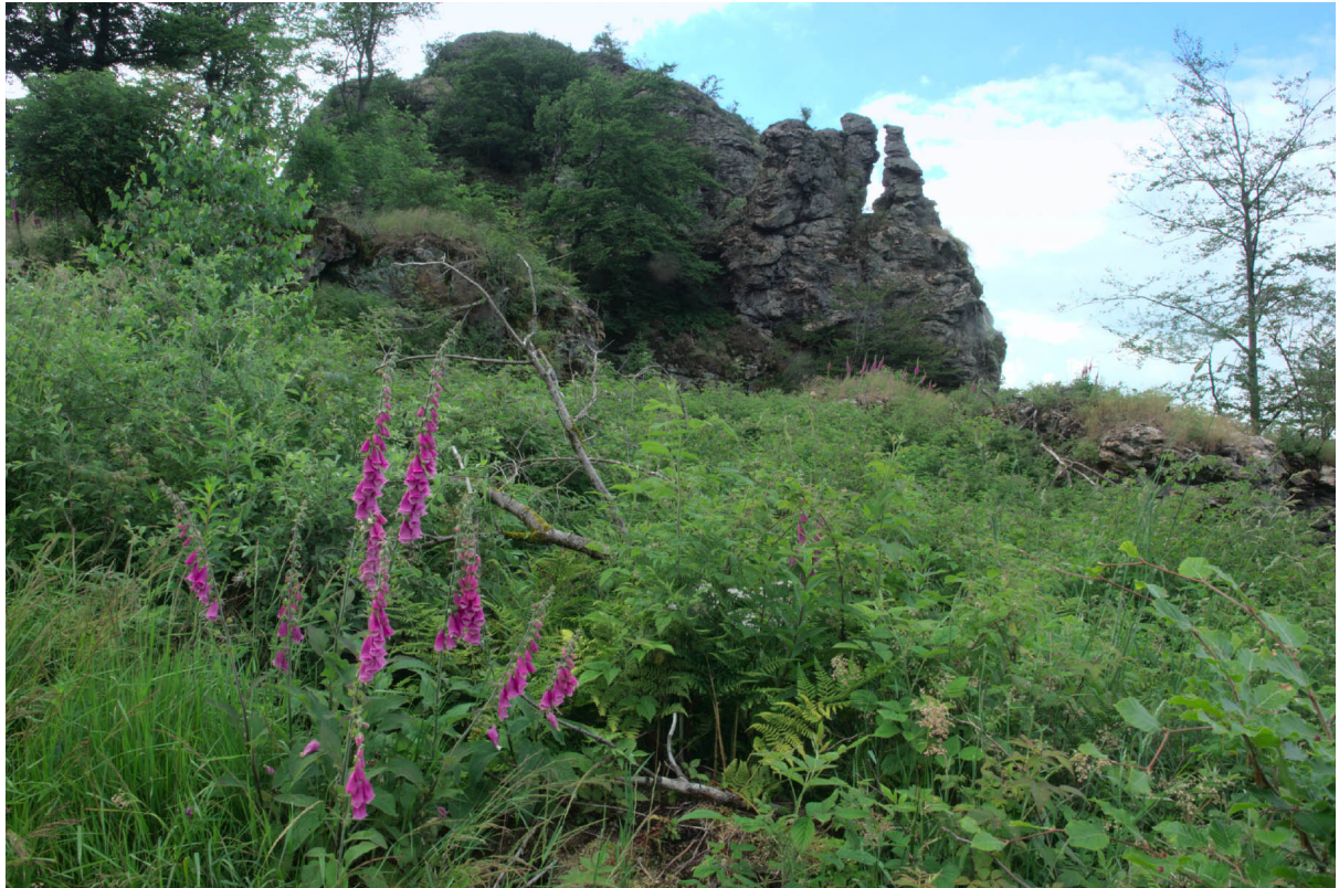
Ausläufer des Goldsteins

Olympus OMD E-M1 MIII · 12–40 mm · f/13 · 12 mm · 1/20 s · ISO 200