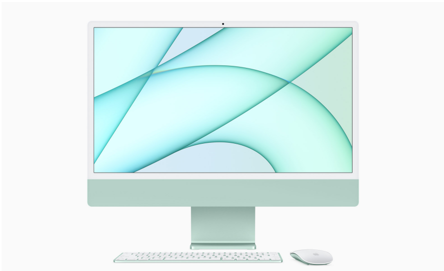
Ein Desktop-Computer aus dem Hause Apple: der iMac.