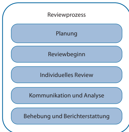
Abb. 4–1 Aktivitäten im Reviewprozess